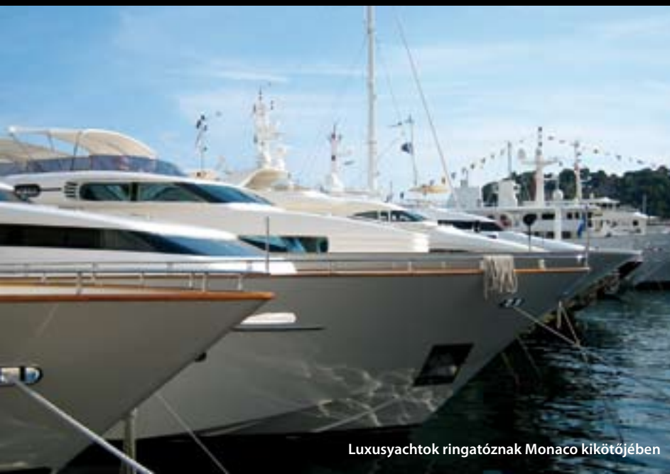
Luxusyachtok ringatóznak Monaco kikötőjében

A 120 kilométer hosszú, napfényes Côte d'Azur az olasz határtól az itthon leginkább lelkes csendőreiről elhíresült St. Tropez-ig terül el. Az Azúr-parton nyújtózik Monaco is, mely a Vatikán után a világ második legkisebb állama; négy városnegyede – Monaco, Monte-Carlo, La Condamine, Fontvieille – közül kaszinói révén Monte-Carlo neve ma már egyet jelent a fényűző gazdagsággal. A kaszinók kaszinóját 1878-ban alapították meg a telente délre húzódó uralkodó osztály szórakoztatására. A XIX. század végét nevezték később a francia Riviéra fénykorának, a belle époque-nak, ekkortájt épültek fel többek között az Antibes-fok álomvillái és hotelpalotái, melyek közül néhány még napjainkban is működik, tanúskodva a legendás korszak különleges eleganciájáról. A tenger marta sziklapárkányok romantikus szépsége, az olajfaligetek csendje, és Antibes ódon hangulatú zezugos utcái az írókat és a képzőművészeket is mágnesként vonzotta magához, a város többek között Picasso egyik kedvelt tartózkodási helye is volt.