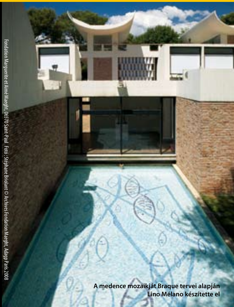
A medence mozaikját Braque tervei alapján Lino Melano készítette el