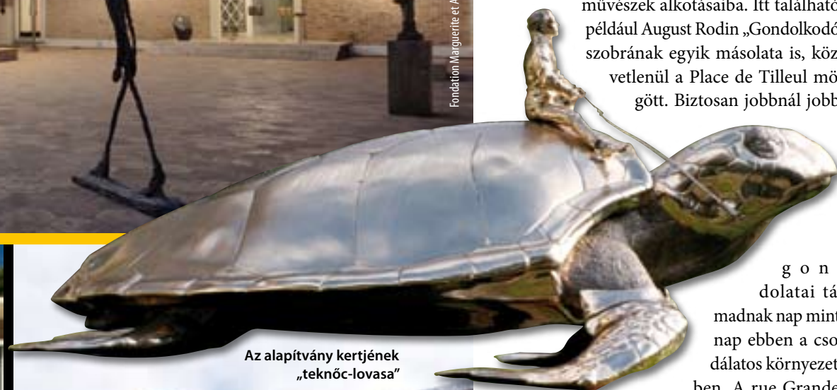
Az alapítvány kertjének „teknőc-lovasa”

Az óváros egyetlen főutcáját a rue Grande vágja ketté. Az utcák burkolatát művészek tervezték, melyet óránként speciális járművek tisztítanak meg. A várost különleges, urna alakú kútja és rengeteg művészeti galériája teszi izgalmassá. Több mint harminc galéria enged bepillantást a művészek alkotásaiba. Itt található például August Rodin „Gondolkodó” szobrának egyik másolata is, közvetlenül a Place de Tilleul mögött. Biztosan jobbnál jobb