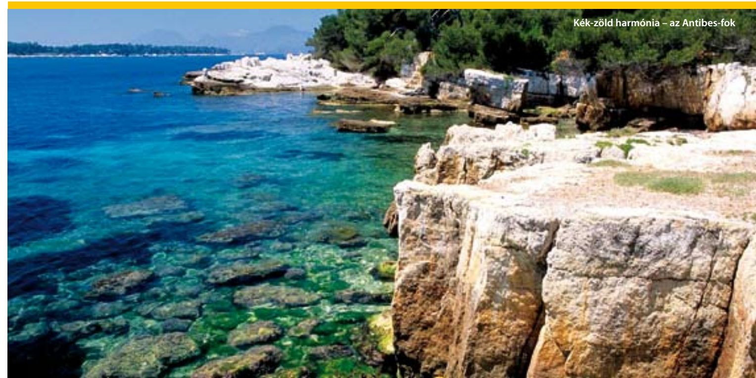
Kék-zöld harmónia – az Antibes-fok

életműve előtt tisztelegnek a művészek életútját, alkotásait bemutató kiállítások. A Mentoni erőd egyik bástyájában található a Cocteau-múzeum, a településen a Városháza házasságkötő termét is Jean Cocteau festményei díszítik. A tengerpartot kísérő hegyvidéken is érdemes elidőznünk és felkeresni a varázslatos hangulatú kis falvakat. Ilyen például Vallauris, ahol Pablo Picasso alapított egy fazekasműhelyt, mely még ma is működik,