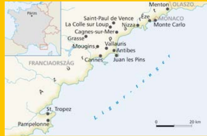
  THE EXPLORER MAP

Nem elfelejtend , hogy a C te d’Azur „a vil g legnagyobb sz npada”, közel 500 m vészeti  s 100 folkl rikus rendezv ny- nyel, 20 nemzetk zi fesztiv llal  s 150 id szakos vagy  lland  ki llit ssal  ven- te. Tavasszal a grasse-i r zsafesztiv l, a cannes-i filmfesztiv l, a monac i Forma-1, ny ron a nizzai  s Juan-les- Pins-i jazzfesztiv l,  sszel b lok, sz re- tek, m g t l v g n a tavaszk sz nt  nizzai vir gkarnev l, a mentoni citromfesztiv l  s a mandelieu-i mim za nnep v rja az ide l togat kat.