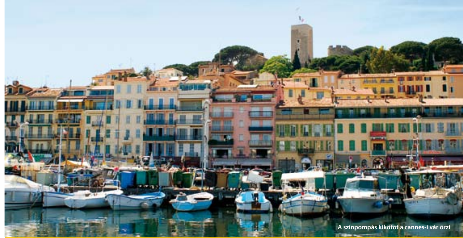
A színpompás kikötőt a cannes-i vár őrzi

Monaco és Antibes mellett olyan városok sorakoznak itt, mint a hajdan olasz illetékességű Nizza, ahol a művészet szerelmesei 18 múzeumban ismerkedhetnek a nagy mesterek alkotásaival, vagy a filmfesztiváljáról nevezetes Cannes. Az egykori kis halászfalu napjainkra a filmművészet fővárosává nőtte ki magát, ahol mindennapos látványt jelentenek a luxus limuzinok, a filmsztárok, és a milliárdokat érő yachtok. Ha azonban szeretnénk mi is itt, a ragyogás középpontjában élni, vigyázzunk: Európa ezen része a lehető legdrágább! Egy kisebb vityilló négyzetméterének ára Cannes-ban átlagosan 4400 euró körül mozog. Ettől függetlenül sokaknak van itt a környéken egy „la résidence secondaire”-jük, vagyis második lakóhelyük. Ezeket a házakat nem csupán a felső tízezer vásárolja fel, sokan a volt szovjet birodalomból is ide tették át lakóhelyüket.