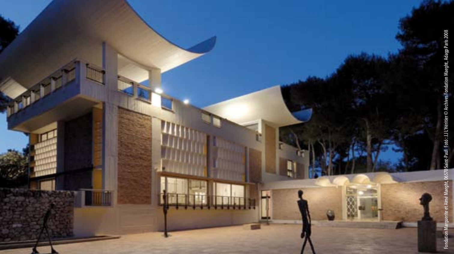
Fondation Marguerite et Aimé Maeght, 06570 Saint-Paul