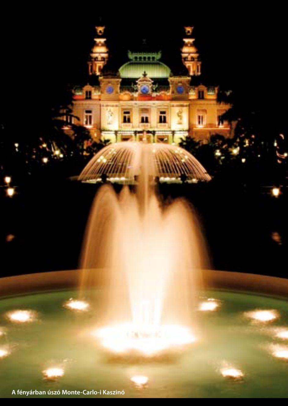
A fényárban úszó Monte-Carlo-i Kaszinó