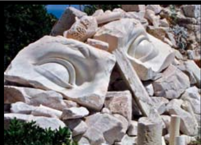
Az antibes-i Picasso M zeum terasz t Germaine Richier alkot sai d szitik